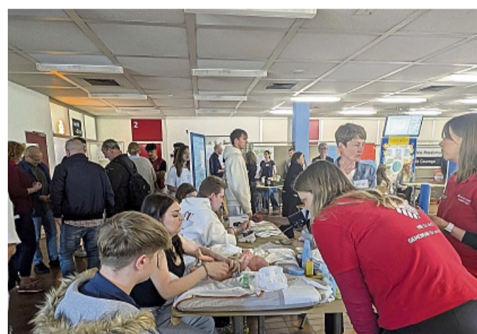
Säuglingspflege: Unter fachkundiger Anleitung von angehenden Erzieherinnen und Erziehern konnte an lebensechten Babypuppen etwa das Wickeln von Säuglingen geübt werden.