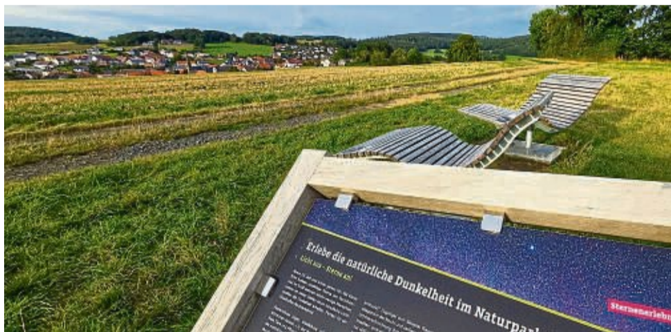
„Licht aus – Sterne an!“ heißt es, wenn das leise Rauschen der Nacht das Erlebnis auf dem „Mühlengrund“ umrahmt. Unweit der Hergertsmühle, oberhalb von Seigertshausen, laden zwei Sternliegen dazu ein, den Blick gen Himmel zu richten.

– ein Paradies für alle, die sich für die Natur begeistern können. Besonders beeindruckend ist der Basaltschutthang unweit der Sauerburg, eine markante Felsformation, die dem Weg eine beinahe mystische Kulisse verleiht.