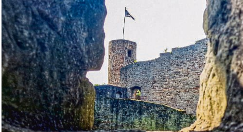
Highlight des Premiumspazierweges: die romantische Ruine der Burg Wallenstein.

Wer sich für besondere Naturräume und eine faszinierende Vogelwelt interessiert, wird beispielsweise auf dem Fabelweg „Falkenflug“ fündig. Die Route führt oberhalb des Freibads am Erleborn in Homberg durch das Naturschutzgebiet „Mosenberg“ und offenbart eine Landschaft, die noch immer die Spuren der historischen Waldweide trägt. Zwischen Hecken und alten Bäumen lassen sich mit etwas Glück Wanderfalken, Schwarzspechte oder Neuntöter entdecken