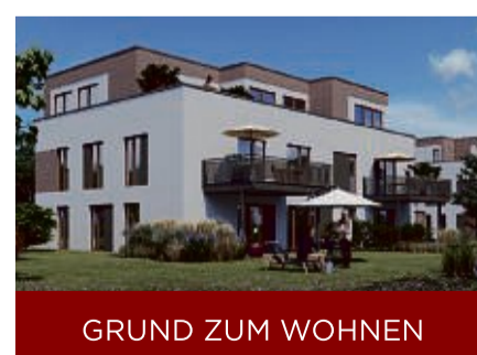
GRUND ZUM WOHNEN