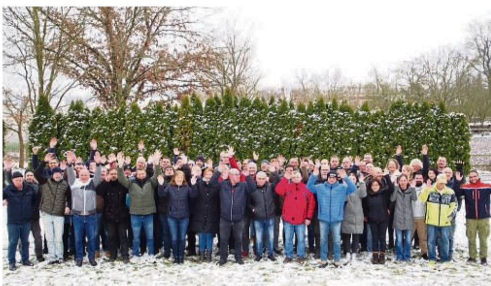
Die große Gringel Familie bei der diesjährigen Veranstaltung zum Saisonstart.