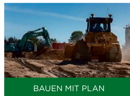
BAUEN MIT PLAN

GESTALTER UND BEWAHRER NACHHALTIGER LEBENSÄRÄUME