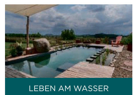
LEBEN AM WASSER